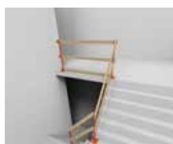
ESCALIER À ANGLE DANS DIFFÉRENTES DIRECTIONS