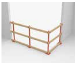
ANGLES DE 90 DEGRÉS