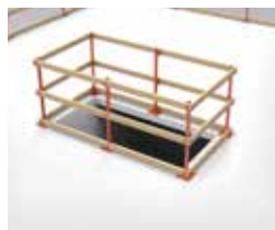
OUVERTURES CARRÉES ET RECTANGULAIRES