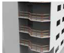
BALCONS ET OUVERTURES IRRÉGULIÈRES