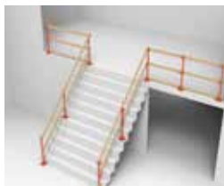
ESCALIER À ANGLE AVEC OUVERTURE SUR DEUX CÔTÉS