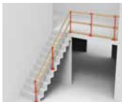
ESCALIER À ANGLE AVEC UNE SEULE OUVERTURE