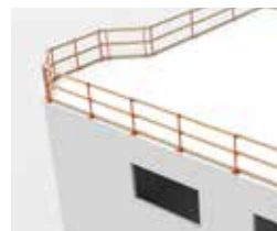
CORNICHES ET PÉRIMÈTRES